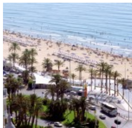
La plage du « Postiguet »