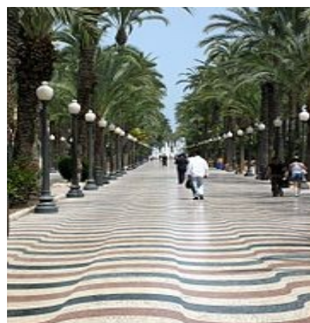
Une des plus belles promenades de la ville « l'Esplanada », jalonnée de palmiers et bordée par le bassin du port.

« C'est dommage qu'on n'ait pas fait un voyage pour les rencontrer », Elise (3 ème )